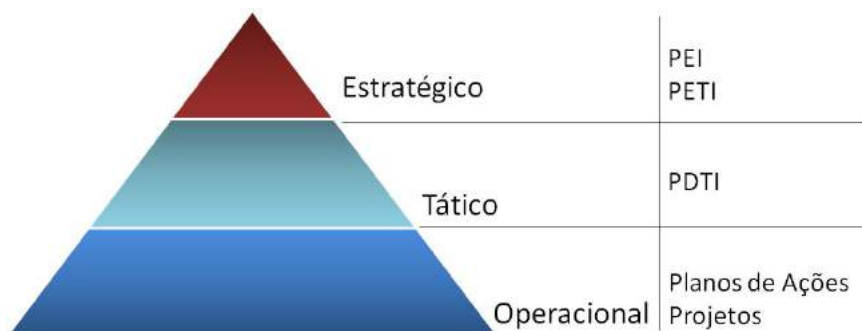
Figura - Instrumentos de Planejamento

No âmbito do Tribunal de Justiça da Paraíba - TJPB, o PDTI sistematiza o planejamento tático da gestão de TI em médio prazo. Projetos e ações, orçamento, contratações, capacitações, gestão das pessoas de TI e processos de governança canalizam as ações da Diretoria de Tecnologia da Informação - DITEC materializadas neste documento.