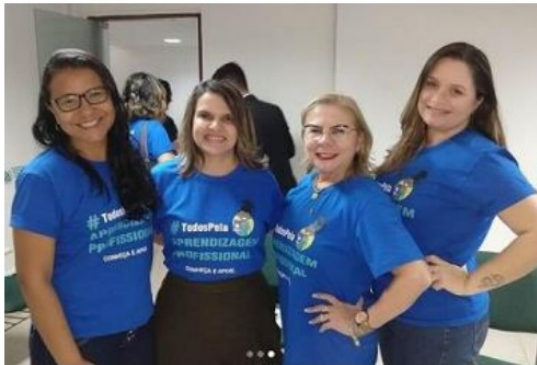
PARTICIPAÇÃO DA REUNIÃO DO FÓRUM DE APRENDIZAGEM PROFISSIONAL DA PARAÍBA – FEVEREIRO/2020