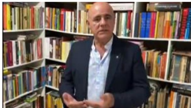
MENSAGEM SOBRE O TRABALHO INFANTIL E CAMPANHA NACIONAL "Covid-19: agora mais do que nunca proteja crianças e adolescentes contra o trabalho infantil." – JUNHO//2020