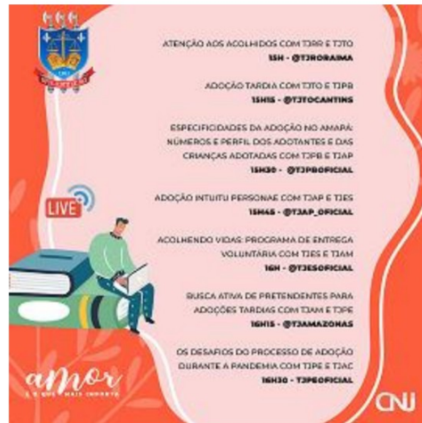
PARTICIPAÇÃO NA LIVE DO CNJ NA SEMANA DA ADOÇÃO - MAIO/2020