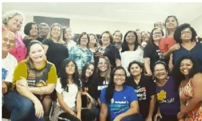
PARTICIPAÇÃO NA REUNIÃO DO FEPETI/PB - FEVEREIRO//2020