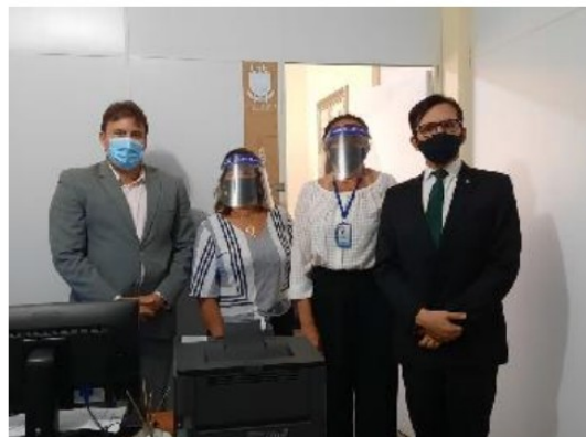
DEPOIMENTO ESPECIAL NA COMARCA DE ITAPORANGA - 2020