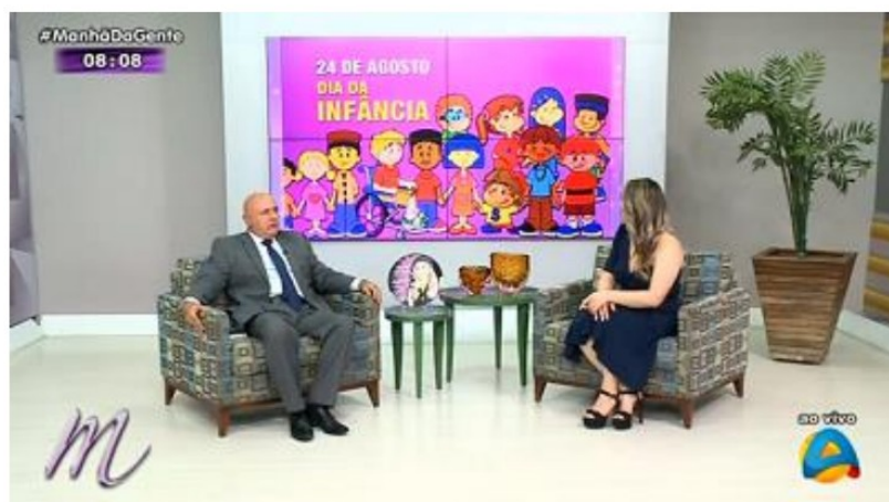
ENTREVISTA A TV MASTER SOBRE A PROTEÇÃO DA INFÂNCIA – AGOSTO//2020