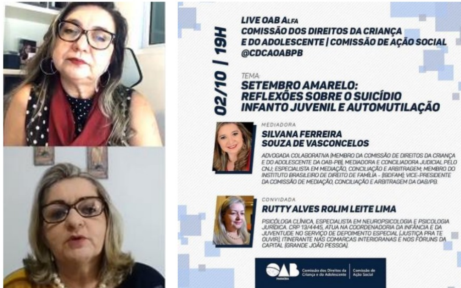
PARTICIPAÇÃO EM LIVE DA OAB/PB SOBRE O SETEMBRO AMARELO - OUTUBRO/2020