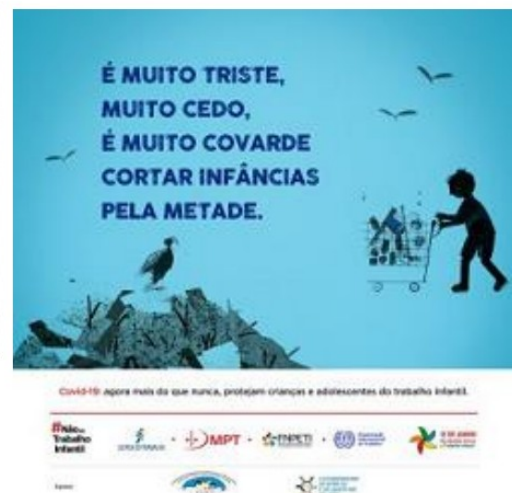
MENSAGEM SOBRE A CAMPANHA NACIONAL CONTRA O TRABALHO INFANTIL - JUNHO//2020