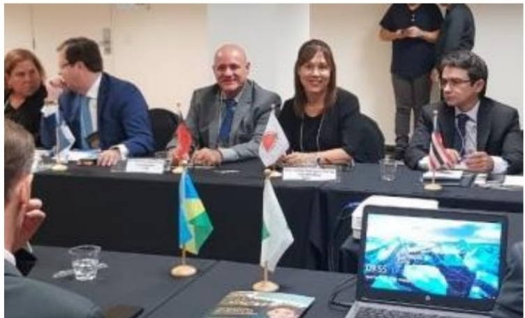
XV ENCONTRO DO COLÉGIO DE COORDENADORES DA INFÂNCIA E DA JUVENTUDE DOS TRIBUNAIS DE JUSTIÇA DO BRASIL - MARÇO/2020