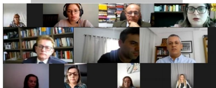
WEBINÁRIO SOBRE "O APLICATIVO A.DOT E SUA IMPORTÂNCIA PARA A ADOÇÃO" – AGOSTO//2020