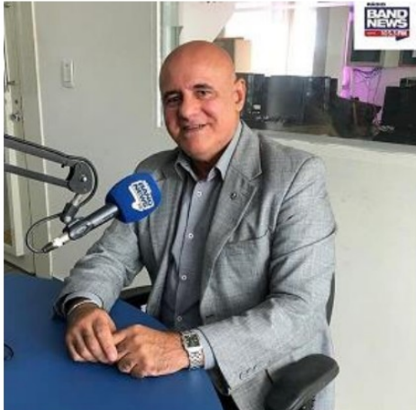
ENTREVISTA SOBRE PREVENÇÃO DA GRAVIDEZ NA ADOLESCÊNCIA – FEVEREIRO/2020