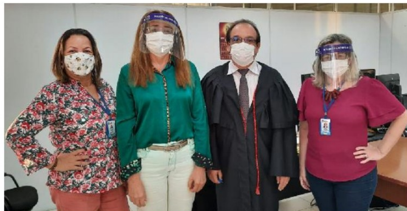
DEPOIMENTO ESPECIAL NA 1ª VARA REGIONAL DE MANGABEIRA - 2020