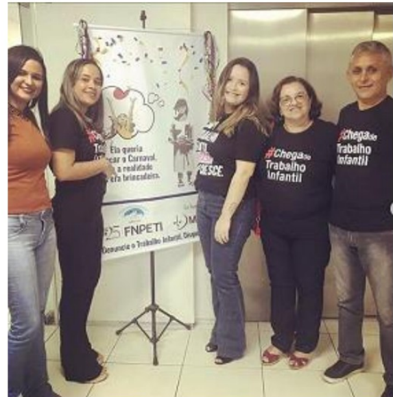
PRESENÇA NO LANÇAMENTO DA CAMPANHA #CHEGADETRABALHOINFANTIL, REALIZADO PELO MPT/PB - FEVEREIRO2020