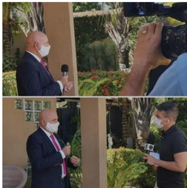
ENTREVISTA A TV CABO BRANCO SOBRE OS 30 ANOS DO ECA– JULHO//2020