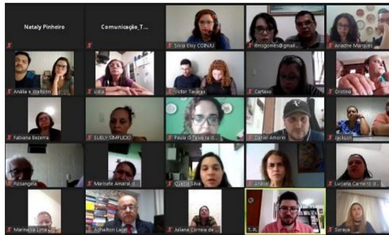
ABERTURA DO 1º CURSO DO ADOÇÃO ONLINE DA 1ª CIRCUNSCRIÇÃO – AGOSTO//2020

COORDENADORIA DA INFÂNCIA E DA JUVENTUDE