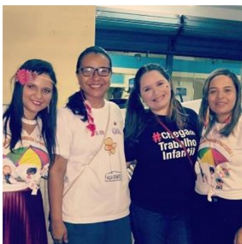
PARTICIPAÇÃO NA AÇÃO JUNTO AOS FOLIÕES SOBRE A IMPORTÂNCIA DA PROTEÇÃO INTEGRAL DE CRIANÇAS E ADOLESCENTES – FEVEREIRO/2020