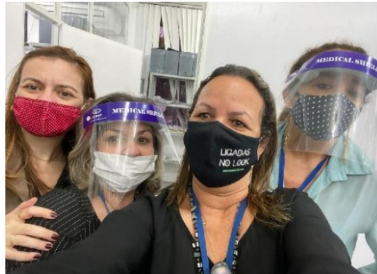
DEPOIMENTO ESPECIAL NA COMARCA DE GUARABIRA - 2020