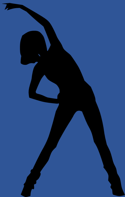
Costas - Região Lombar